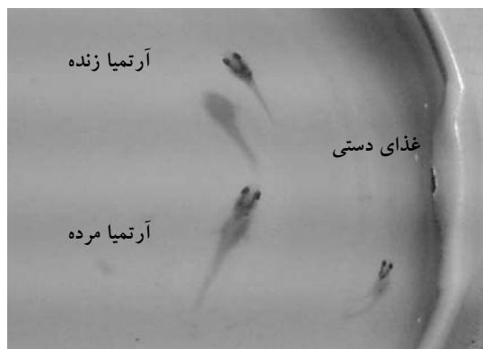
شکل ۲- تفاوت در اندازه لاروهای سه تیمار آزمایشی

• حروف مشابه در هر ستون نشان‌دهنده عدم وجود اختلاف آماری بین تیمارها می‌باشد.