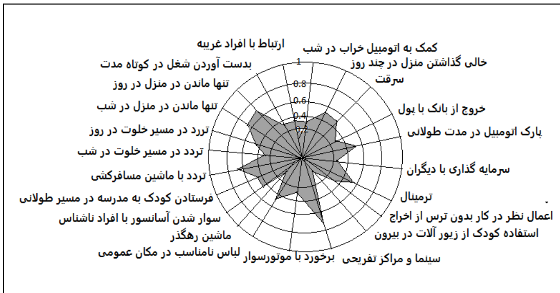
شکل (۳): رادار مؤلفه‌های امنیت زنان در شهرستان بهشهر

همچنین بر اساس نتایج بدست آمده در شکل (۳) مؤلفه‌های امنیت در تنها بودن در منزل در روز با نمره ۰/۷۲ در بهترین وضعیت و استفاده از زیور آلات برای کودکان در بیرون از منزل با نمره ۰/۱۱ در بدترین وضعیت پایداری قرار دارند. بر اساس یافته‌های بدست آمده از بارومتر پایداری و رادار بارومتر در شکل‌های (۲) و (۳) از لحاظ شرایط پایداری امنیت زنان در شهرستان بهشهر در وضعیت متوسط قرار دارند و این امر حاکی از آن است که وضعیت امنیت زنان در شهرستان بهشهر می‌تواند با ایجاد شرایط بهتر در زمینه‌ی امنیت اجتماعی و کالبدی، بهبود یابد.