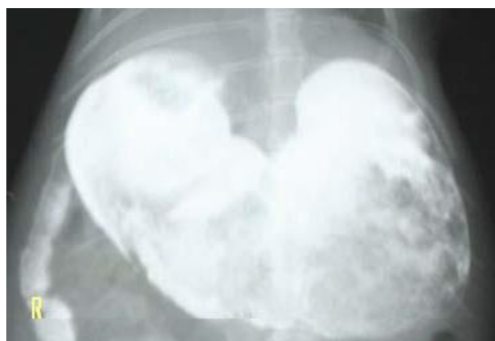
تصویر 2: شکل و موقعیت معده خرگوش در نمای شکمی-پشتی

شکل معده در خرگوش شبیه شکل معده در سگ و گربه است. مهره دوم کمری یا به عبارت دیگر از فضای بین دنده ای 9 تا فضای بین دنده ای 12 قابل مشاهده است. (تصویر 1). در نمای شکمی- پشتی معده در قسمت میانی و در دو سمت ستون مهره ها قرار دارد. (تصویر 2) جنبی به طور متوسط در فضای بین مهره دوازدهم سینه ای تا انتهای