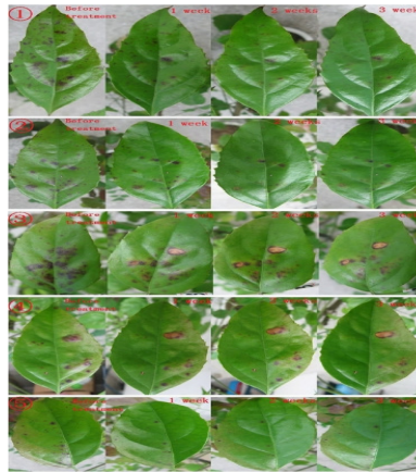
شکل ۱. علائم اولیه از ۵ برگ آلوده به قارچ C. gloeosporioides و نشانه‌های بهبودی پس از تیمار توسط پلازما از هفته اول تا سوم (Xiong et al. , 2014).

قطر ۳۶۰ میکرومتر تشکیل شده است، یک کوارتز فایبر توخالی با قطر داخلی ۴۰۰ میکرومتر و قطر خارجی ۱/۲ میلی متر، و یک بخش لوله‌ای با قطر داخلی ۰/۵ میلی‌متر، که همگی در داخل یک پوشش پلی‌تترا فلور اتیلن که نوعی پلی‌مر با وزن مولکولی بالا است و نسبت به خواص الکتروسیسته عایق است، در اطراف آن قرار می‌گیرد. سیم تنگستن به‌عنوان یک الکتروود ولتاژ بالا، به یک فیبر تو خالی مهر و موم شده و در یک سر دستگاه قرار داده می‌شود. یک فیلم نقره در سطح خارج از لوله شیشه‌ای به عنوان الکتروود زمین عمل می‌کند (Xinng et al. , 2010). این دستگاه همچنین گاز را با جریان استاندارد ۱/۵ لیتر در هر دقیقه، با ولتاژ وسیعی از ۱۵-۰ کیلو ولت در فرکانس ۸/۷ کیلو هرتز از طریق لوله شیشه‌ای تزریق می‌کند. دستگاه پلازما می‌تواند توسط کارشناس در دمای اتاق (۳۰ درجه سلسیوس) بدون هیچ گونه آسیبی به بافت برگ گیاه آلوده به بیمارگر، گازهای مختلف را رهاسازی نماید. معمولاً فاصله بین خروجی از لوله شیشه‌ای و برگ گیاه ۱/۵ سانتی‌متر در نظر گرفته می‌شود (شکل ۲) (Xinng et al. , 2010; Dunlap et al. , 1994). مدت زمان آزادسازی گاز توسط دستگاه پلازما، نباید بیش‌تر از ۲۰ ثانیه باشد، در غیر این‌صورت منجر به آسیب دیدن رگبرگ‌ها و سلول‌های گیاهی می‌شود (Xiong et al. , 2014).