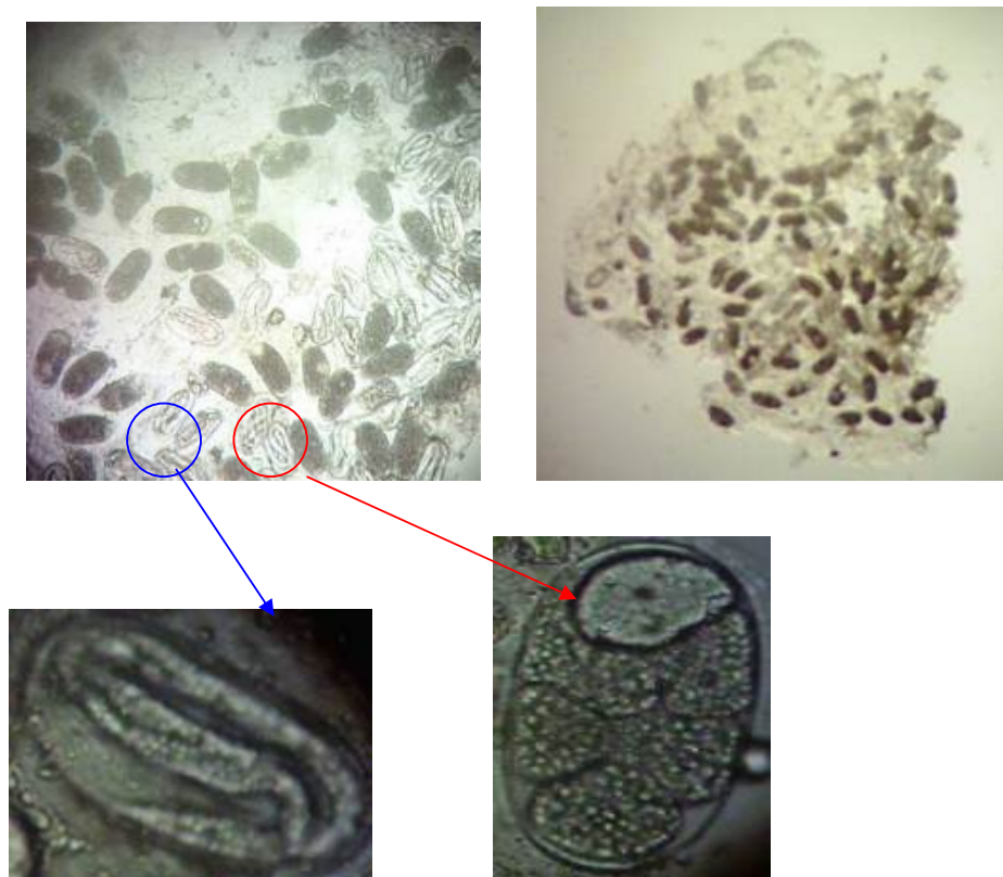
شکل ۲- توده تخم نماتود مولد گره ریشه توتون M. incognita با بزرگنمایی ۴۰ میکروسکوپ نوری Fig. 2. Egg mass of root knot nematode M. incognita with 40 Light microscope