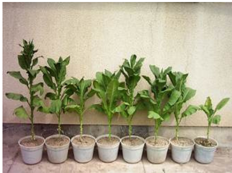
شکل ۷- ارتفاع بوته‌ها در تیمارهای مختلف در چین سوم- ۶۵ روز بعد از نشاکاری (از راست به چپ: شاهد آلوده، نماکور ۴۰، ۶۰ و ۸۰ روز بعد از نشاکاری، راگبی ۴۰، ۶۰ و ۸۰ روز بعد از نشاکاری، شاهد غیرآلوده)

Fig. 6. Plant height in different treatments in 3 th time 65 days after transplanting (right to left: control with infection, Rugby 40, 60 and 80 kg/ha after transplanting, control without infection)