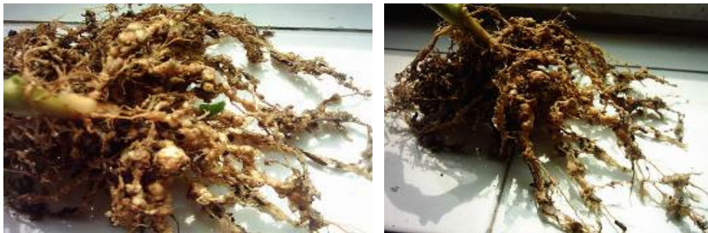
شکل ۱- علائم گال نماتود مولد گره ریشه توتون M. incognita بر روی ریشه توتون در تیمار شاهد آلوده Fig. 1. Gall Symptoms of root knot nematode M. incognita on tobacco root in infected control.

با توجه به نتایج طرح‌های اجرا شده طی سال‌های گذشته مبنی بر آلودگی اکثر مناطق کشت توتون به نماتود گره ریشه و با توجه به عدم وجود رقم مقاوم در بین ارقام تجاری رایج در منطقه (Sajjadi et al. , 2010) و گسترش آسان این بیماری به مناطق غیرآلوده توسط آب آبیاری، ادوات کشاورزی و نشاهای آلوده، یافتن راهکار مؤثری برای کنترل این بیماری ضروری به نظر می‌رسد. برای کنترل این بیماری راه‌های متفاوت از جمله: کاشت ارقام مقاوم، پیشگیری، تناوب، آفتابدهی، استفاده از گیاهان تله و کنترل شیمیایی وجود دارد که کنترل شیمیایی کاربردی تر از سایر روش‌ها بوده و امکان اجرای آن در سطوح محدود وجود دارد. هدف از این تحقیق تعیین بهترین نوع، مقادیر و زمان مصرف سموم ناکور و راگی در کاهش جمعیت نماتود مولد گره ریشه توتون و تأثیر آن بر صفات زراعی توتون بود.