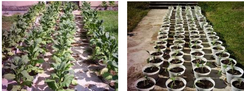
شکل ۳- گلدان‌های آزمایشی در مراحل اجرای طرح

کاملاً تصادفی با ۲۰ تیمار شامل ۲ نماتودکش نماکور گرانول ۱۰ درصد و راگی گی گرانول ۱۰ درصد (شرکت بایر دریافتی از مؤسسه تحقیقات گیاه پزشکی کشور) و سه سطح مختلف نماتودکش به میزان ۴۰، ۶۰ و ۸۰ کیلوگرم در هکتار معادل ۰/۲، ۰/۳ و ۰/۴ گرم برای هر گلدان و در سه زمان مصرف قبل، همزمان و یک هفته بعد از نشاءکاری و تلقیح با ۳۰۰۰ لارو و تخم در هر کیلوگرم خاک گلدان به همراه یک تیمار شاهد آلوده و یک تیمار شاهد غیرآلوده در چهار تکرار انجام شد. گلدان‌ها در محوطه مرکز تحقیقات و آموزش تیرتاش طی فصول بهار (متوسط دما ۱۹/۱ درجه سلسیوس) و تابستان (متوسط دما ۲۶/۷ درجه سلسیوس) نگهداری شده و هر روز یکبار و در روزهای گرم دو بار آبیاری شدند. قبل از نشاءکاری به گلدان‌ها به میزان یک گرم نیترات آمونیوم، یک گرم سوپرفسفات و سه گرم سولفات پتاسیم به عنوان کود (NPK) اضافه گردید (شکل ۳).