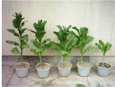
شکل ۵- ارتفاع بوته‌ها در تیمارهای مختلف در چین سوم- ۶۵ روز بعد از نشاکاری (از راست به چپ: شاهد آلوده، نماکور ۴۰، ۶۰ و ۸۰ روز بعد از نشاکاری، شاهد غیرآلوده)

Fig. 5. Plant height in different treatments in 3 th harvest 65 days after transplanting (right to left: infected control, Nema cure 40, 60 and 80 kg/ha after transplanting, healthy control)