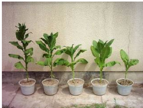
شکل ۶- ارتفاع بوته‌ها در تیمارهای مختلف در چین سوم- ۶۵ روز بعد از نشاکاری (از راست به چپ: شاهد آلوده، راگبی ۴۰، ۶۰ و ۸۰ روز بعد از نشاکاری، شاهد غیرآلوده)

Fig. 5. Plant height in different treatments in 3 th harvest 65 days after transplanting (right to left: infected control, Nema cure 40, 60 and 80 kg/ha after transplanting, healthy control)