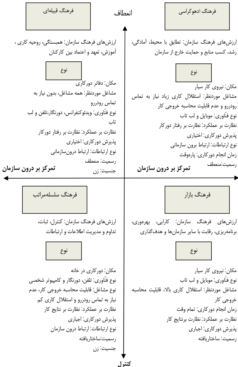
شکل شماره 1- مدل مفهومی پژوهش