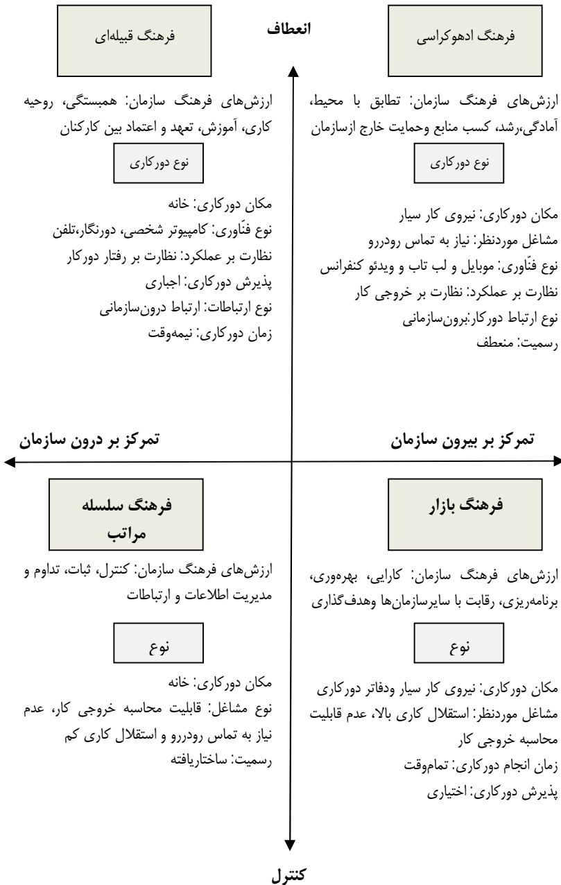
شکل شماره 3- مدل نهایی تحقیق